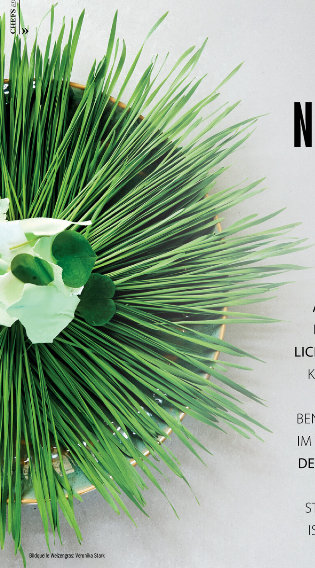
Bildquelle Weizen gras: Veronika Stark